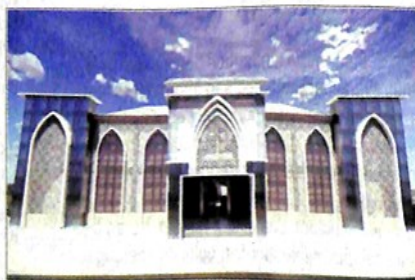
FOTO asrama baru Thawalib Putra.

kan, penyusunan RKA Yayasan Thawalib tahun 2022 telah melalui berbagai tahapan dan proses mulai dari usulan yang disampaikan kepala sekolah, pengelola asrama dan stakeholder lainnya dalam lingkungan yayasan, kemudian dibahas bersama pengurus dan pengawas dan terakhir diajukan kepada dewan pembina untuk ditetapkan. "Mekanisme penyusunan RKA melalui berbagai tahapan sesuai