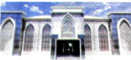
ASRAMA BARU THAWALIB PUTRA

Pembiayaan berbagai kegiatan yang dilaksanakan unit sekolah serta asrama merupakan upaya dalam mewujudkan target pendidikan yang telah ditetapkan dalam Peraturan Khittah Pendidikan Perguruan Thawalib. Peningkatan layanan pendidikan tersebut menjadi perhatian dalam pembahasan dalam RKA Yayasan Thawalib tahun 2022 oleh dewan pembina, dewan pengawas dan Dewan Pengurus Yayasan Thawalib pada 30 Desember 2021 lalu.