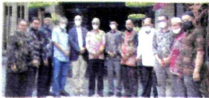
PEMBINA dan Pengurus Yayasan Thawalib Padang Panjang Berfoto Bersama

Pada tahun 2022 Yayasan Thawalib Padang Panjang menitikberatkan Rencana Kerja dan Anggaran (RKA) kepada peningkatan layanan pendidikan. Baik dalam bentuk layanan sarana prasarana pendidikan maupun layanan dalam proses belajar mengajar.