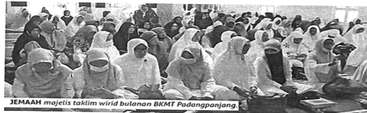
JEMA'AH majelis taklim wirid bulanan BKMT Padangpanjang.