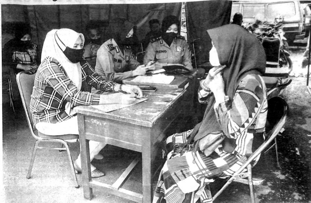
MASYARAKAT antusias ketika mengikuti vaksinasi di sejumlah gerai yang disediakan Pemko Padangpanjang.

Lomba Sumdarsin, Vaksinasi Digelar di Lima Lokasi