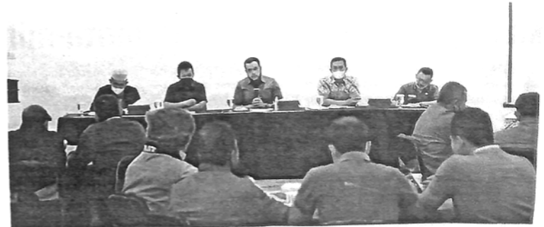
WALIKOTA Padangpanjang Fadly Amran menggelar silaturahmi dan rapat program awal tahun 2022 bersama camat dan lurah se-Kota Padangpanjang di pendopo rumah dinas walikota, Kamis malam (6/1).

"Lurah dan camat harus sering turun ke lapangan dan berbaur dengan masyarakat. Tampung semua aspirasi masyarakat. Carikan solusi untuk setiap permasalahan yang ada di tengah-tengah masyarakat," tutur Asrul. (sup/2)