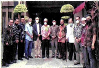
PENGELOLA Yayasan Thawalib Padangpanjang